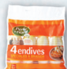
4 Endives spéciales à Braiser