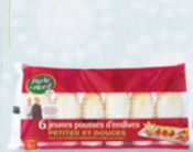
6 jeunes pousses d'endives