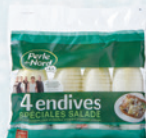
4 Endives spéciales Salade