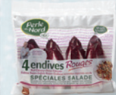
4 Endives Rouges spéciales Salade