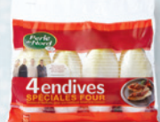
4 Endives spéciales Four